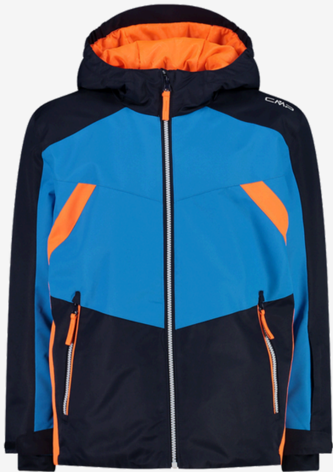
Abrigo de esquí